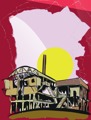
Oficina Salitrera SANTA LAURA